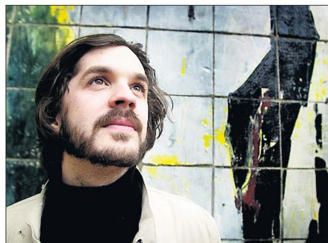
Thomas Dybdahl - norsk sanger - udsender en trilogi der er imødeset i hele skandinavien.