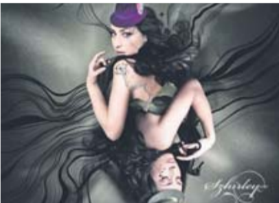
Szhirley optræder i Assens.

Curtis Stigers byder sikkert på sange fra hele karrieren, herunder også fra pladen "You Inspire Me", der i 2003 blev kåret som "Det bedste jazzalbum" af The London Sunday Times. (subt)