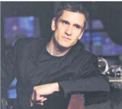
Curtis Stigers. PR-FOTO