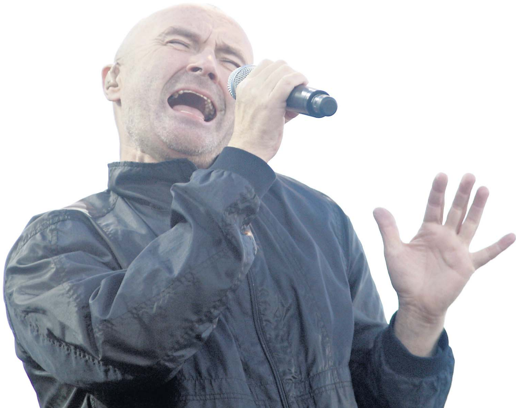
En vindjakke er ikke en speciel festlig mundering til en fest med 36.000 gæster. Men Phil Collins virkede heller ikke just til at være i partymode i Herning.

BØGER: Den norske forfatter Per Petterson har fået den litterære pris IMPAC-Prisen for sin roman "Ud og stjæle heste". Petterson var en af otte nominerede og fik prisen i konkurrence med kendte navne som J.M. Coetzee, Cormac McCarthy, Salman Rushdie, Jonathan Safran Foer og Julian Barnes.