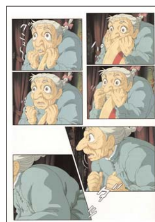
Odeheksen kaster en forbandelse over Sofie, så hun bliver til en 90-årig.

Eneste minus ved Det levende slot er, at den flere steder bærer præg af at være et filmalbum. Billederne bibringer ikke altid noget nyt, de er blot nye sekunder på filmstrimlen.