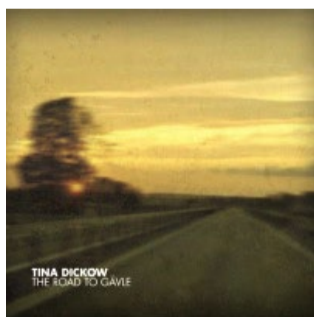
"The Road To Gävle" (2009)