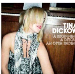
Trilogien "A Beginning, A Detour, An Open Ending" (2008)