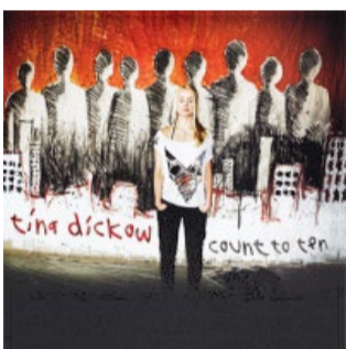
"Count To Ten" (2007)