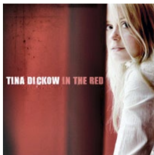
"In The Red" (2005)