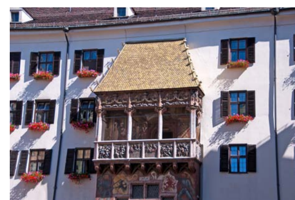
Das Goldene Dachl eller på dansk det gyldne tag er Innsbrucks mest kendte attraktion.