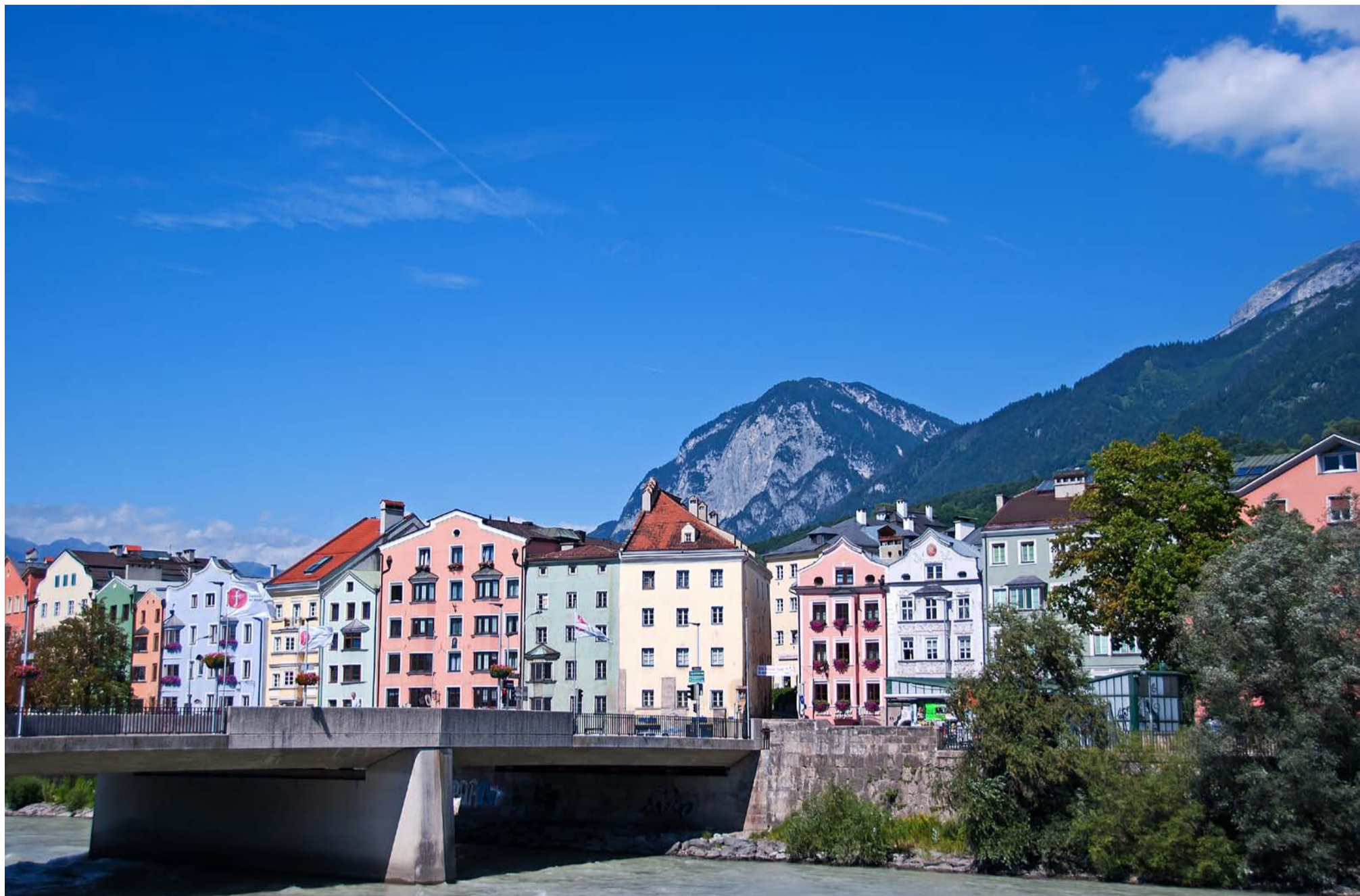
Byens navn skyldes broen over floden Inn, der deler den relativt flade midtby og de kuperede forstæder, der klæber sig op ad Nordkette-bjergene. Den nuværende bro hedder Alte Innbrücke, og hvor den står, har der i snart 1000 år været forbindelse mellem de to bredder.