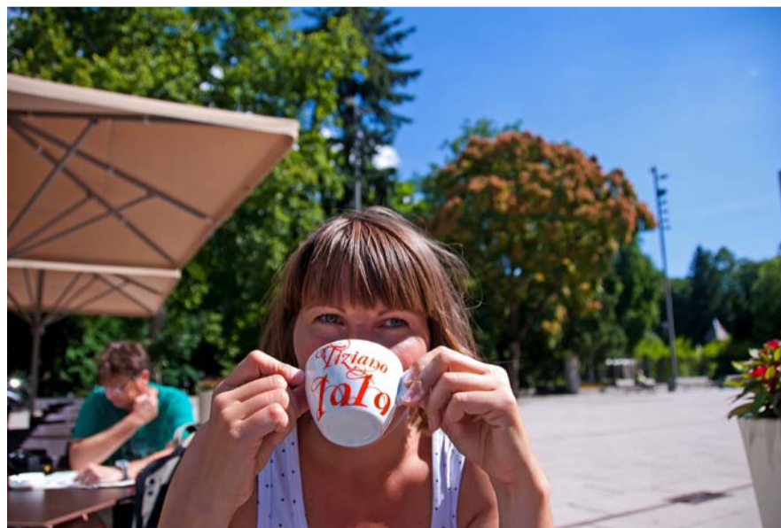
Café Pavillion er et skønt åndehul ved byens gamle teater.

Den overdådigt udsmykkede triumfbue fra 1765 er et meget godt udgangs-