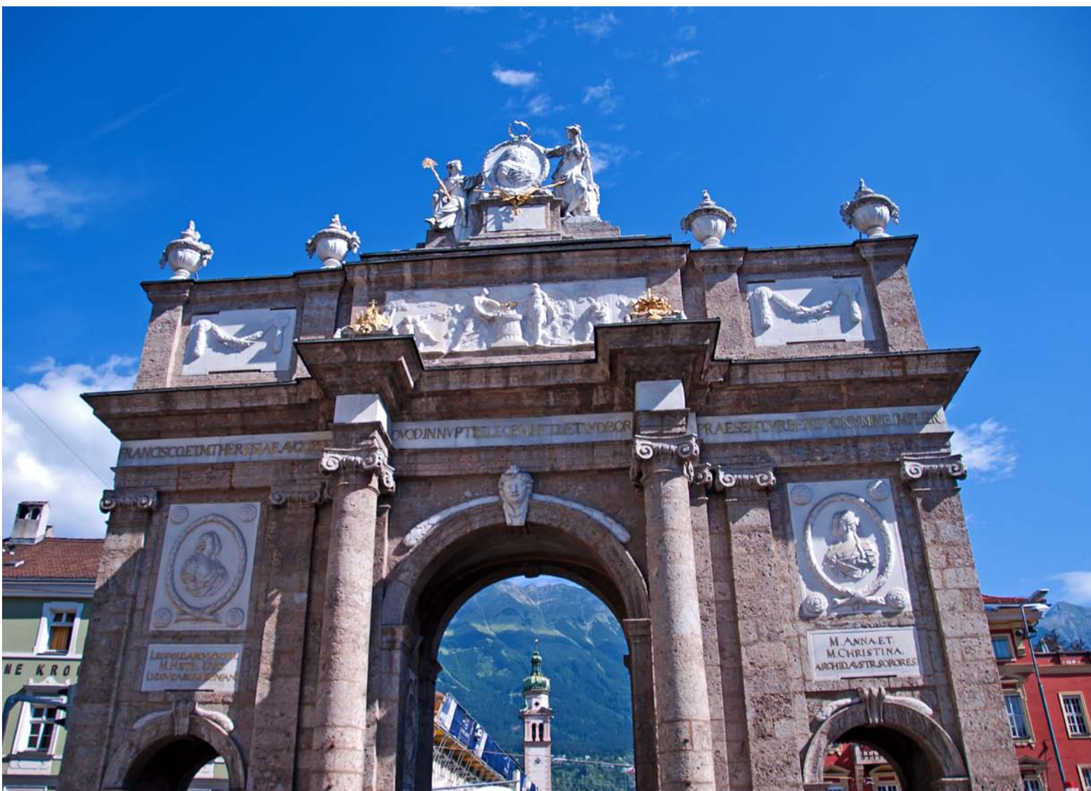
Triumfbuen er et oplagt sted at begynde en byvandring i Innsbruck.