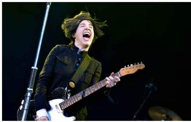
■ Texas i Den Fynske Landsby