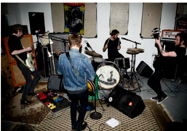
■ Wrong Side of Vegas er det ene af to bands, der optræder på Start! Festival.