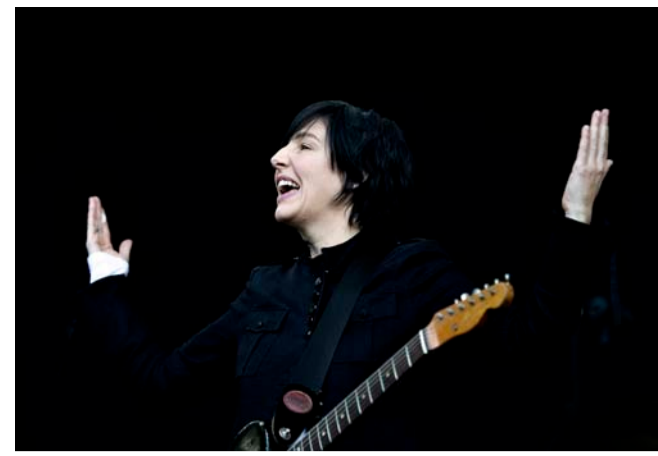
■ Texas i Den Fynske Landsby