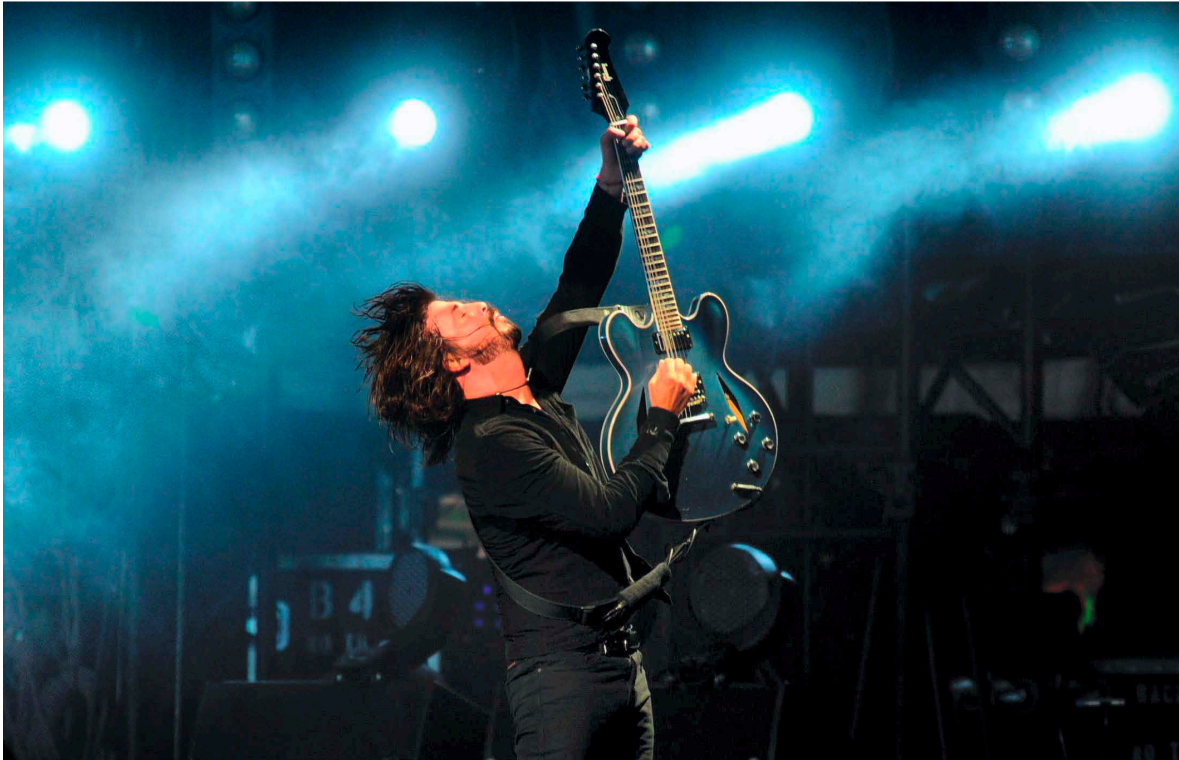
■ Dave Grohl viste igen, at han er en fortræffelig frontfigur for Foo Fighters.

En del af overskuddet fra salget af spændingsromanen går til Dansk Flygtningehjælps arbejde i Den demokratiske Republik Congo.