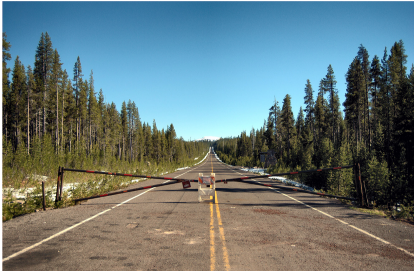
På grund af snefald var en del af vejene rundt om Crater Lake lukkede. Derfor kunne vi desværre ikke vandre helt ned til overfladen.

● I de vestamerikanske stater Californien og Oregon kan man opleve to af kontinentets mest spektakulære naturattraktioner, Yosemite National Park og Crater Lake