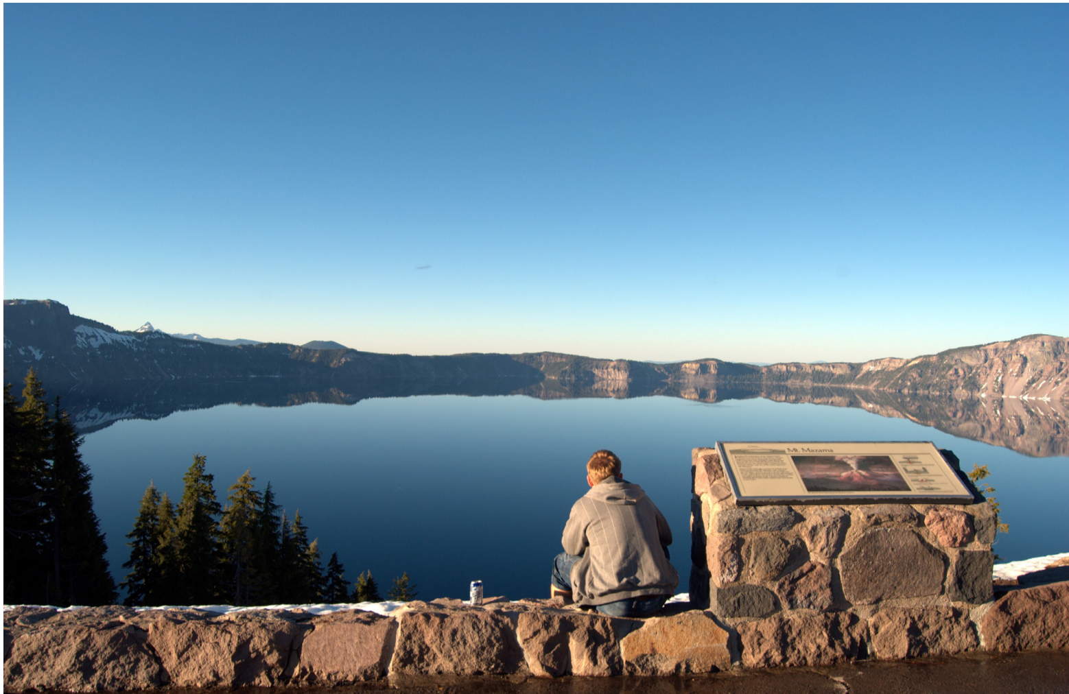
Når man ser ud over Crater Lake, kan det være svært at se, hvor søen ender, og himlen begynder.