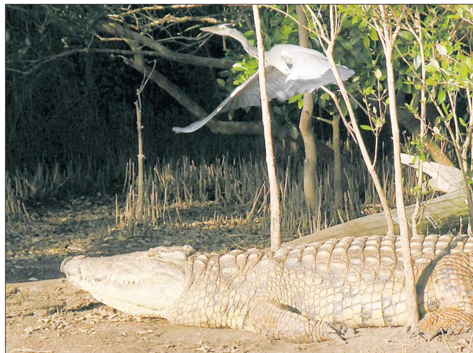
Ved et lykketræf fangede dette billede en hejre, lige idet den flyver over hovedet på en doven krokodille.

På toppen af spændingsbarometeret er uden sammenligning to loveunger, der er med på jagt. De holder sig i baggrunden og betragter, hvordan de to voksne sniger sig gennem et buskads ind på byttet. En kudu-antilope på afveje. Med sømmet i bund kommer den pludselig spurtende ud over et åbent område. Med to hidsige løver i halen. Den løber for livet. Meget forståeligt.