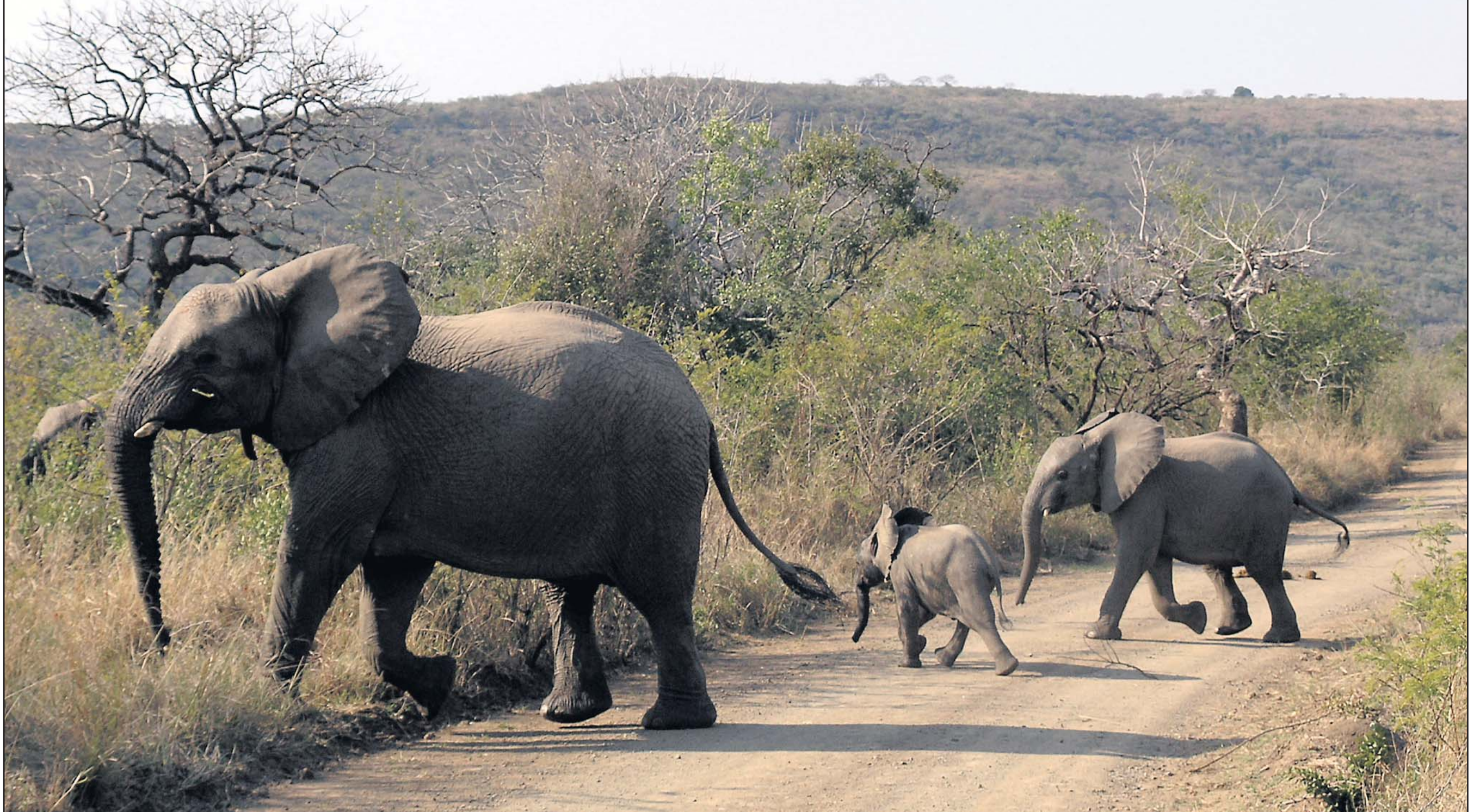
Trip, trap, træsko. Elefanter findes i mange størrelser. Den mindste på cirka en uge vejer kun 150 kilo, så den kan man næsten sidde med i skødet. Nej vel!