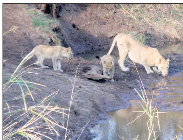
En løvmor hjælper sine unger med at krydse et næsten udtørret flodleje. Forinden havde hun vist dem, hvordan man skræmmer en antilope fra vid og sans.

Køreturen nordpå fra Durban foregår ad en billedsmuk kyststrækning. KORT: GERT EJTON