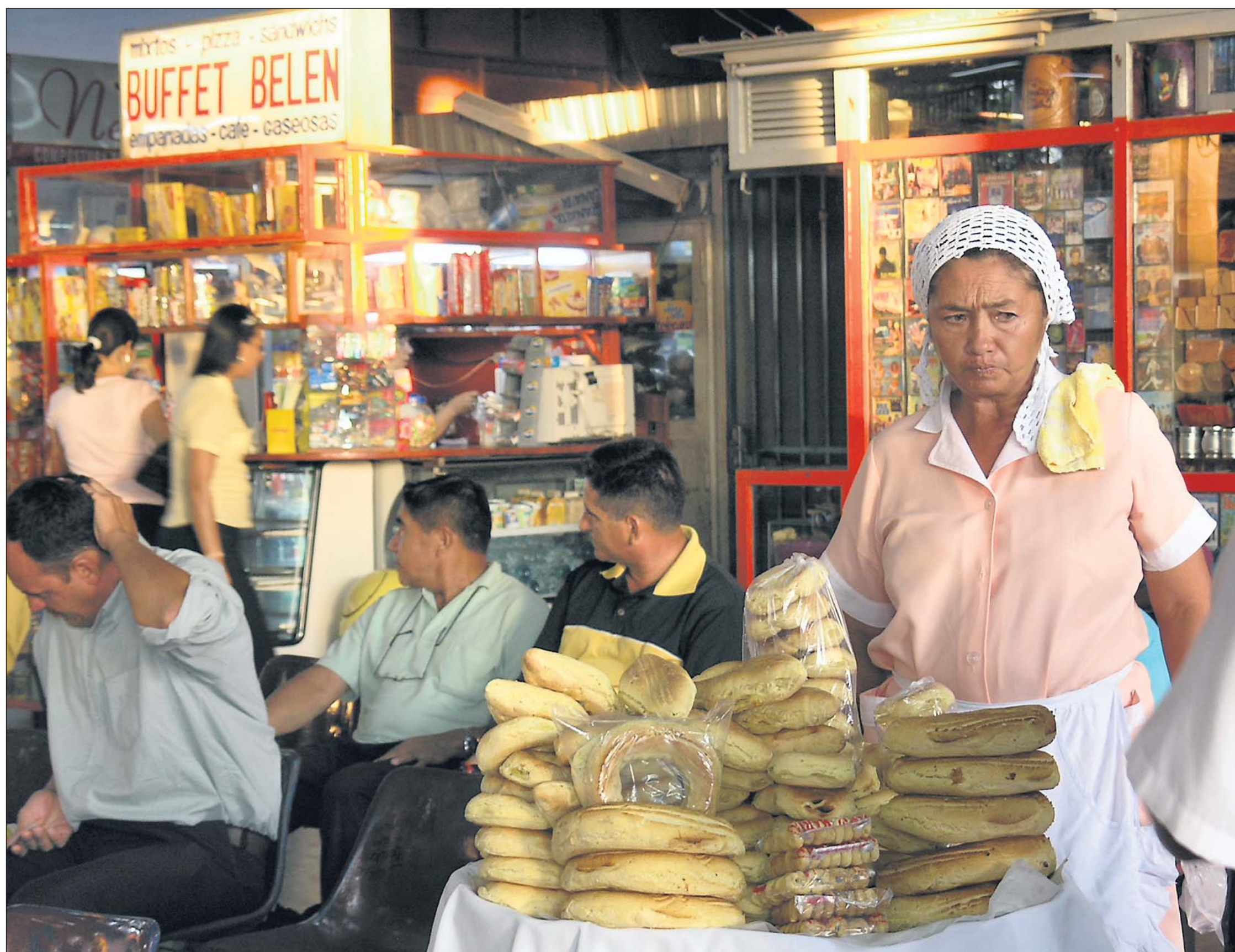
På den centrale busstation i Asunción kan man tilbringe en hel dag med at betragte de sælgende. I forhold til en dansk busstation er udvalget af varer imponerende. Især kager og brød er i høj kurs.