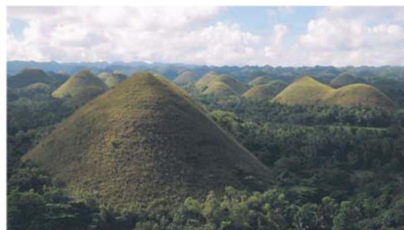
Chocolate Hills på øen Bohol er et af de smukkeste steder på Filippinerne.