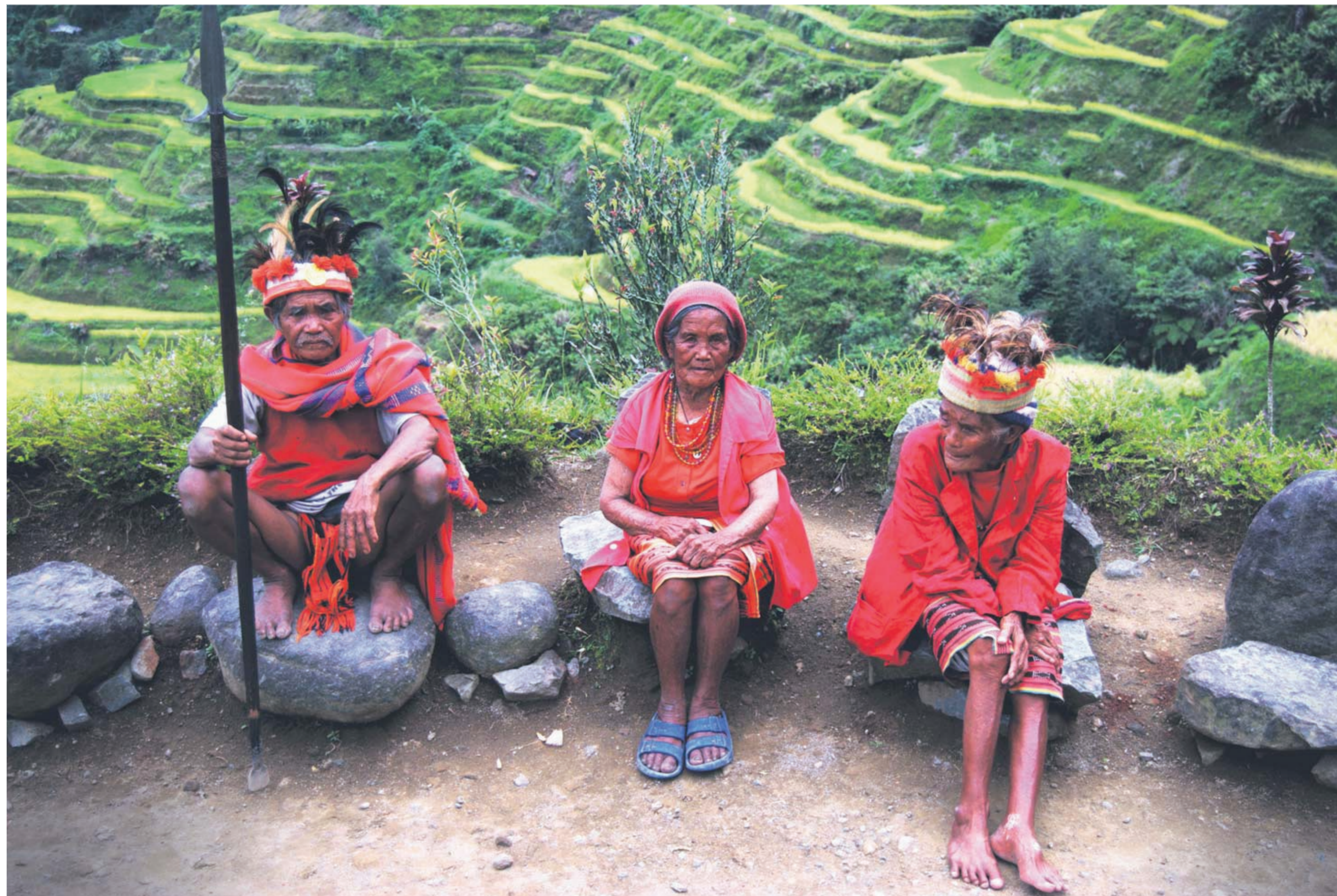
Det kan virke en anelse kunstigt, når gamle bønder sidder udklædt ved seværdigheder i ifugaoernes oprindelige klædedragt. Ikke desto mindre er det et oplagt "Kodak Moment", når baggrundskulissen er de fænomenele risterrasser ved Banaue.