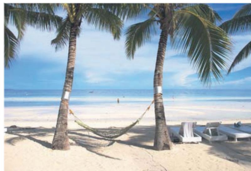
Ferie. Afslapning. Strand. Vand. Dase. Sol. Palmer. Dette billede fra Bohol Beach Club taler vist for sig selv!