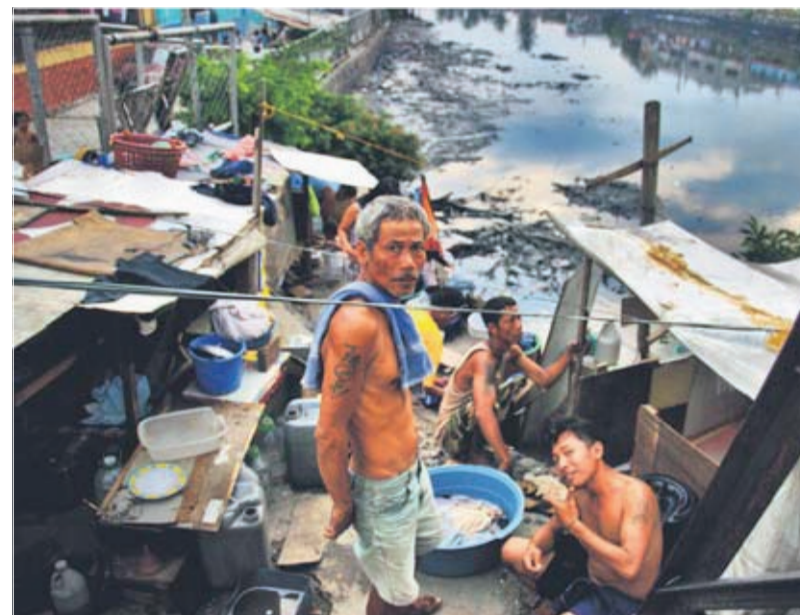
Manila er en metropol på godt og ondt. De enorme slumkvarterer byder på et forfald og svineri, man knap kan forestille sig, levende væsener kan overleve i,