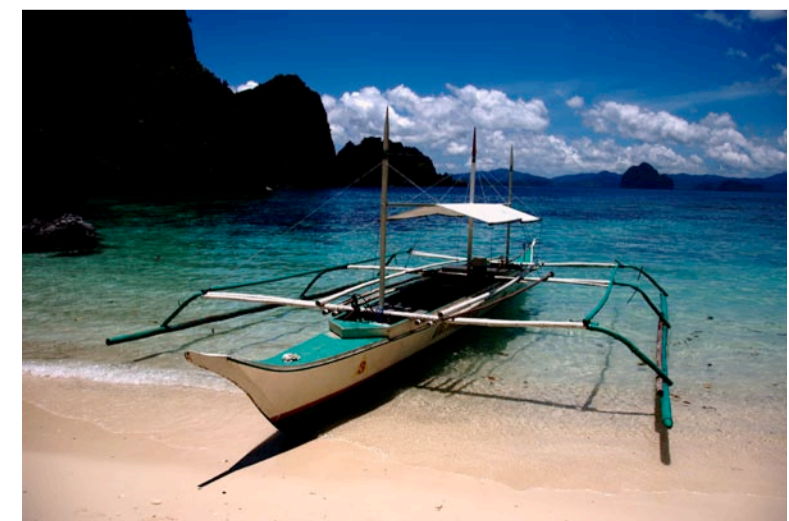
Man bliver fragtet rundt mellem øerne på både som denne. Al transporten er inklusiv i prisen, så man kan vælge og vrage mellem de fleste af de 45 øer omkring El Nido.