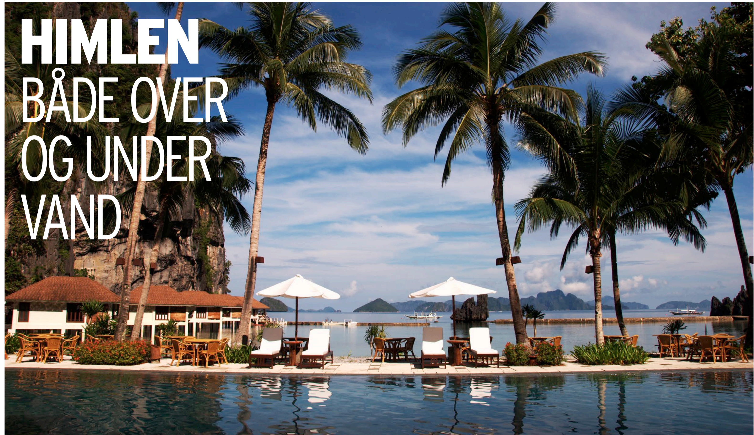
Poolen på Lagen er et kapitel for sig selv. Derfor var det svært at skulle forlade den.

El Nidos 45 øer byder på store, lange, små, krumme, bugtende, beskyttende, sårbare, oversøede eller skyggende strande. Alle besøgende kan finde >>