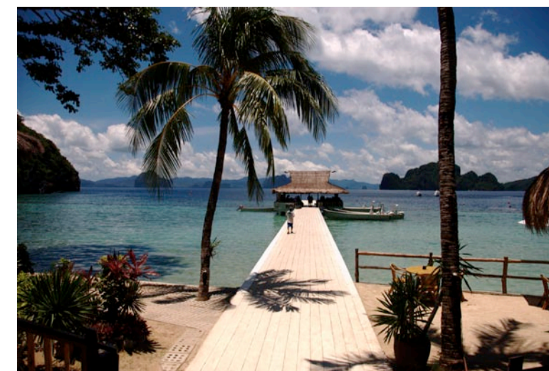
Ved højvande kan man springe direkte i vandet fra terrassen!