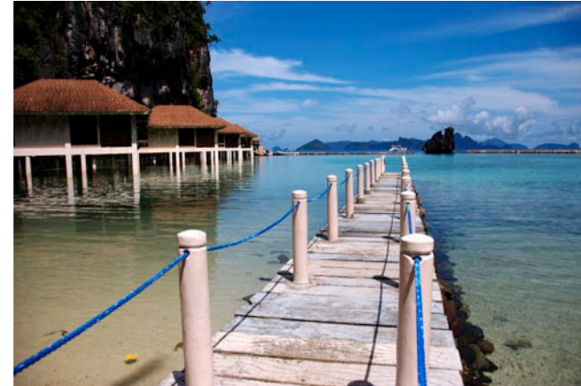
Vandhytterne på Lagen ligger godt i læ for foden af lim-

For yderligere oplysninger tjek www.fimus.dk