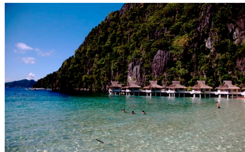
Vandhytterne på Miniloc ligger godt i læ for foden af limstensklipperne.