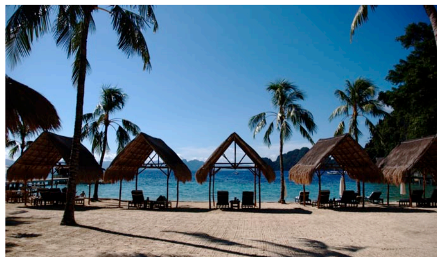
På Miniloc er det ikke noget problem at finde læ for solen i middagstimerne. Små hytter med palmebladstage skygger og sørger for, at man ikke brænder helt op.