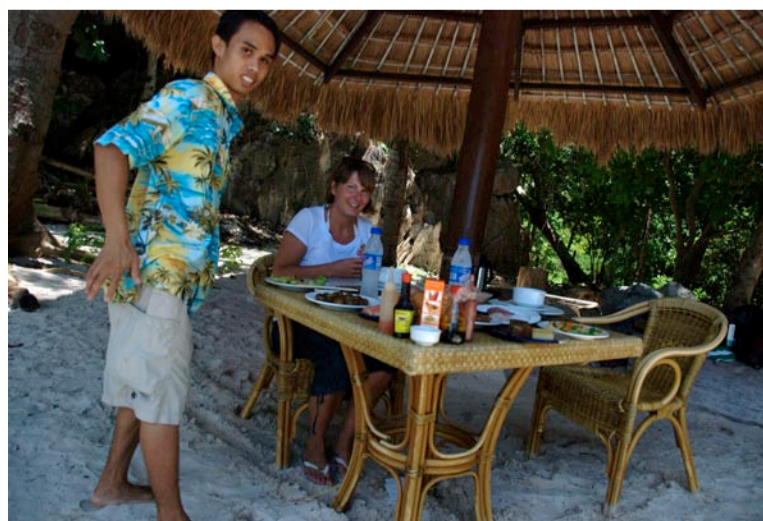
At blive sejlet ud på en øde strand og spise frokost er klimaset på en god ferie. De ansatte tilbereder maden og sejler væk for at komme igen flere timer senere, når man ønsker det.