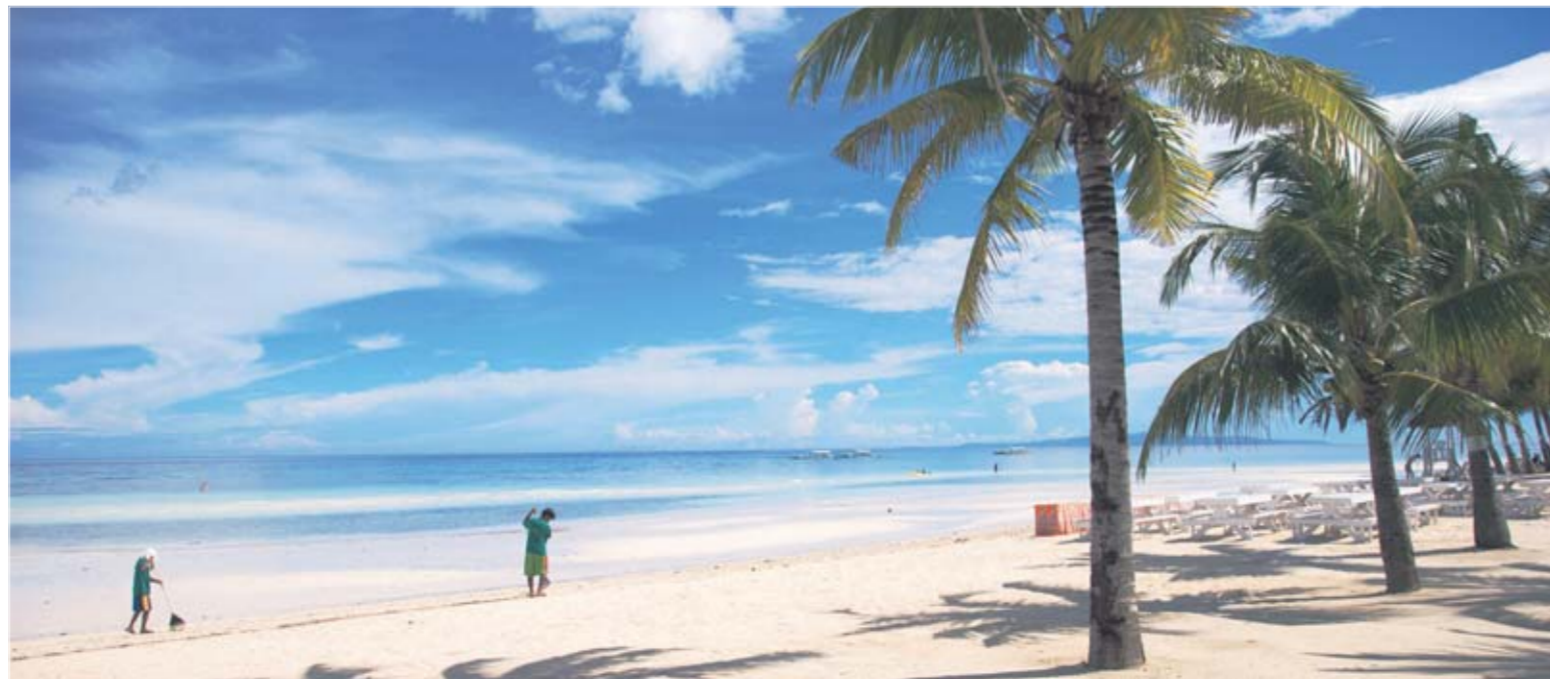
De ansatte på Bohol Beach Club gør deres til, at stranden konstant fremstår ren.

Bakkerne ligger over et område på 50 kvadratkilometer, og der er enorme forskelle i størrelse og antal af "familie-medlemmer" i enklaverne. Nogle af bak-