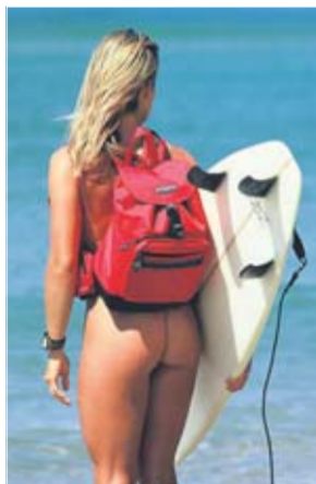
Dejlige damer til mandlige rejsende hos Air Berlin.