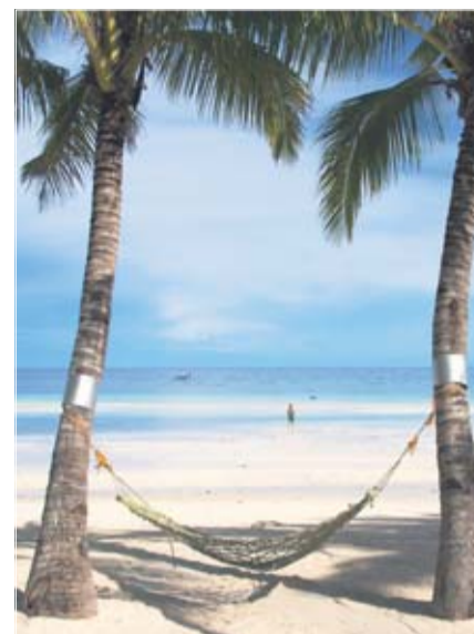
Aaaaaah, den hængekøje kommer jeg til at tænke på mange gange denne vinter, når gråvejret og kulden sænker sig over Danmark.

At veksle mellem liggestolene på stranden og det forbløffende levende Disco-