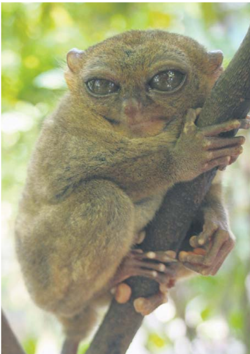
Tarsieren er et lille natdyr, der siges at have givet inspiration til E.T.-figuren. Men det grænser til dyrplageri, at man viser den frem i små bure og vænner den til at være vågne om dagen.