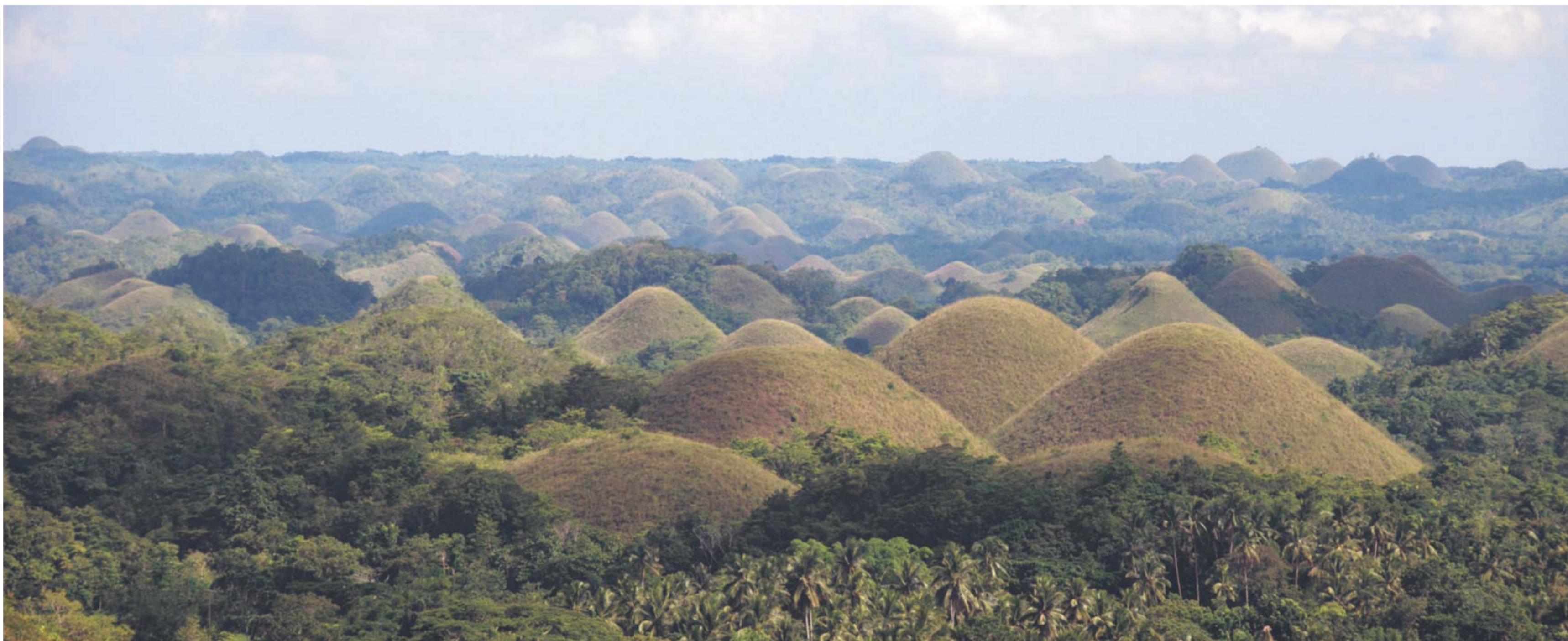
Chocolate Hills - Chokoladebakkerne - har fået deres navn i den tørre årstid, hvor bakkerne bliver afsvedne og brune. I regntiden er de dog bestemt også et besøg værd.