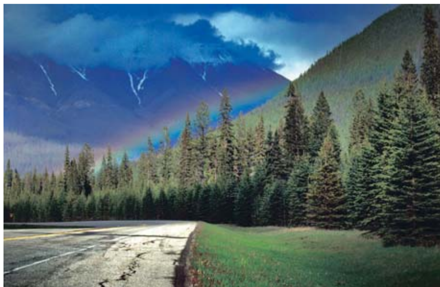
Nogle siger, der gemmer sig guld for enden af regnbuen. I dette tilfælde var guldet en sort bjørn.

At heldet følger den enfoldige, får vi efterfølgende bekræftet i en grad, der overgår alle forventninger. De efterføl-