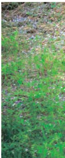
Vi kom tæt på - ca. fem meter fra den ene bjørn med bil- dørene lukket. Og det føltes meget, meget tæt på, selv om der ikke var optræk til ballade.